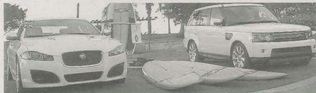
JAGUAR Y Land Rover patrocinadores del evento