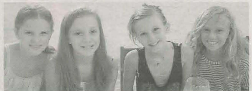
PEQUEÑAS INVITADAS de honor