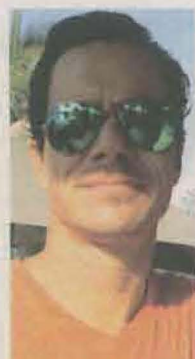
TONY DALTON Actor

IMPORTANTES CELEBRIDADES del medio artístico engalanaron el evento.