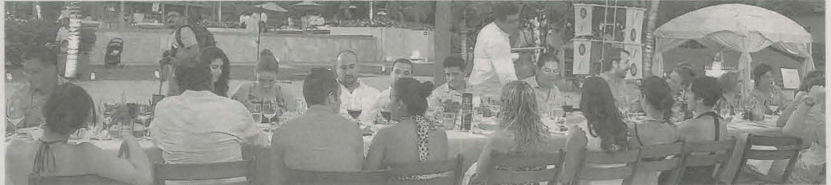
LOS INVITADOS especiales disfrutaron de una agradable velada en St. Regis Punta Mita Resort