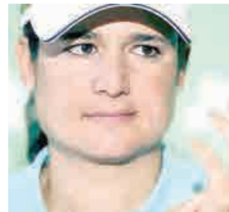
LORENA OCHOA...la reconocida golfista tapatía estará en la V edición del Golf & Gourmet Classic en Punta Mita.

El homicidio de 15 elementos de la Fuerza Única Jalisco marcará sin duda el 2015, un año en el que durante los primeros tres meses y medio el promedio de asesinatos ocurridos en Jalisco asciende a uno cada 8 horas.