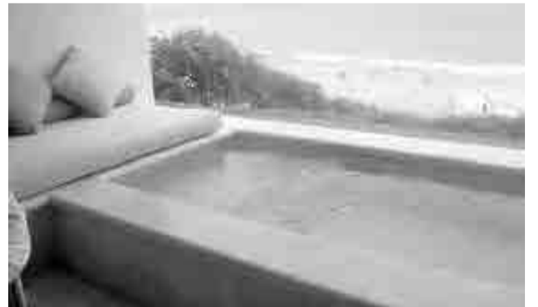
EL TIEMPO compartido ha aumentado sus ventas entre 8 y 10 por ciento.

levante que cada año se incremente el número de galardonados ya que ello representa el compromiso que tienen los prestadores de servicios turísticos con esta región, conscientes de que el compromiso que implica dar servicios de calidad recae directamente en trabajadores que tienen que estar contentos para dar lo mejor de día, todos los días a todos